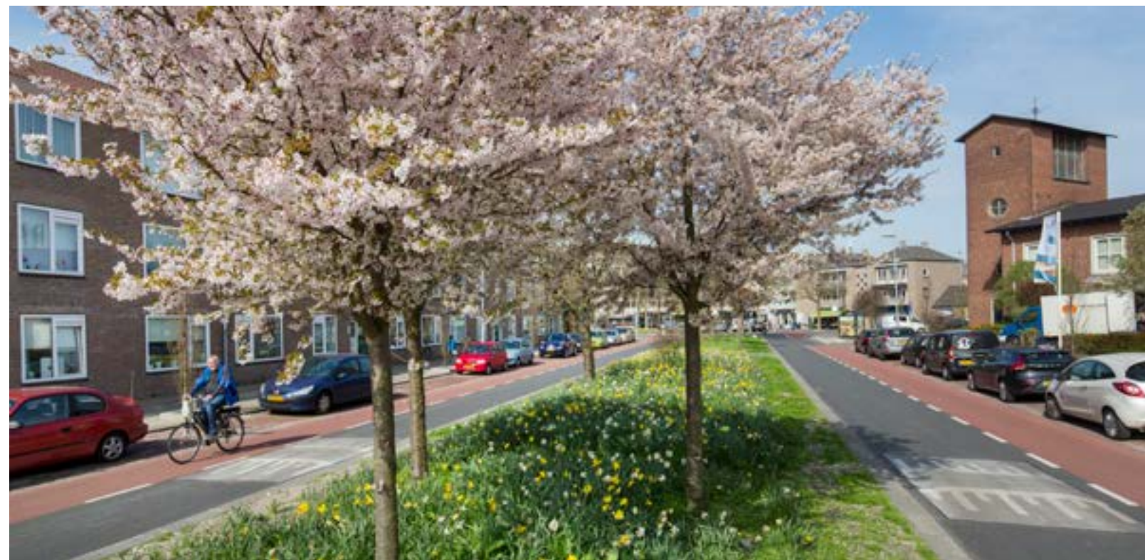
DE EKSTERLAAN – DIE OVERIGENS TOT 1970 EKSTERSTRAAT HEETTE MAAR VANWEGE 'ZIJN WEELDE AAN BLOEIENDE BOMEN' EEN NIEUWE NAAM KREEG – HEEFT ZIJN OORSPRONKELIJKE CHARME WEER TERUG. DE BOMEN IN DE MIDDENBERM STONDEN ER AL, DE BOMEN OP DE STOEP ZIJN NIEUW.

Welke bomen het zijn, weet mevrouw Bouman eigenlijk niet. Maar Theo