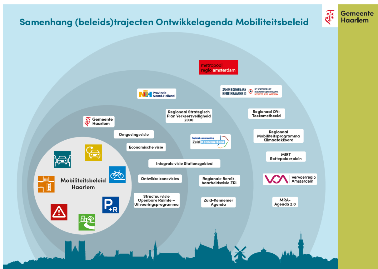
Figuur 2. Overzicht van diverse lokale en regionale (mobiliteits)gerelateerde trajecten

Het programma SBAB is een intensieve samenwerking van Rijk en Regio met als doel de kansen van de groei van het aantal woningen en banen in de Metropoolregio Amsterdam zodanig te benutten dat een aantrekkelijk woon- en vestigingsklimaat wordt behouden. Dit wordt enerzijds uitgewerkt in een lange termijn netwerkstrategie en anderzijds in korte(re) termijn programmalijnen met bijbehorende actieplannen. Het programma integreert studies, zoals het OV-Toekomstbeeld en MIRT-Rotterdamplein zodat goed gefundeerde keuzes gemaakt kunnen worden voor het toekomstige mobiliteitssysteem van de regio en de daarmee gepaard gaande investeringen. Het regionale mobiliteitsprogramma van het Klimaatakkoord wordt ook gecoördineerd vanuit één van de programmalijnen (Slimme en Duurzame Mobiliteit). En vanuit de programmalijn Stedelijke Bereikbaarheid vindt momenteel een studie plaats naar een regionale strategie voor P&R/Mobiliteitshubs. Meer informatie over het programma is te vinden op www.samenbouwenaanbereikbaarheid.nl . De keuzes voor de toekomst die in dit traject worden genomen, zijn uiteraard onlosmakelijk verbonden met het Haarlemse mobiliteitsbeleid.