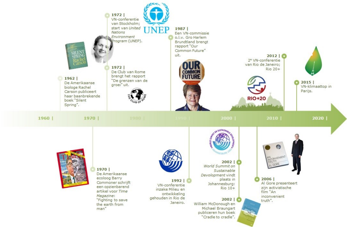
▲ Tijdslijn Internationaal beleid m.b.t. tot duurzaamheid, 1962-2016