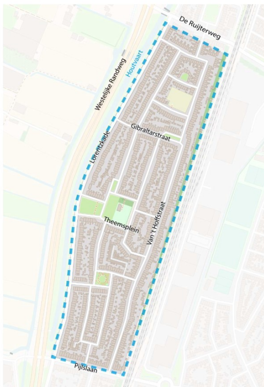
Afbeelding: Houtvaartkwartier Noord

Gemeente Haarlem houdt in uw buurt een onderzoek over betaald parkeren. De gemeente voert dit alleen in, als meer dan de helft van de stemmen vóór betaald parkeren is.